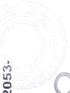
Схема маршрута для подвоза детей автобуса марки ПАЗ 32053-70 гос номер 100 ХВ МОБУ СОШ д. Савалеево

Салимово Ибрагимово ТИДР СВВД Россия по Кареевскому району д. И. Р. Табурганов